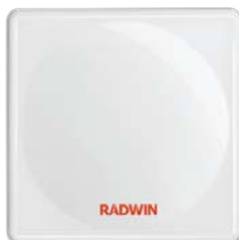
Радиоблок ODU с интегрированной антенной

* Может отличаться в отдельных устройствах